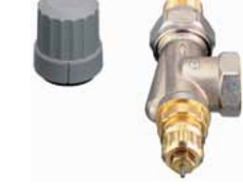
RA-FN Yatay Köşe

■ RA-N Serisi Debi (Reglaj) Ayarlı Vanalar