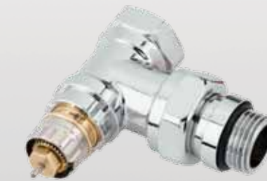
RA-NCX Krom Vana Gövdesi