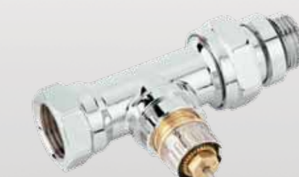
RA-NCX Krom Vana Gövdesi