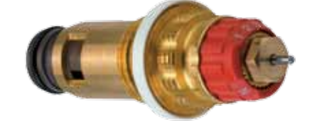
Kompakt Termostatik Radyatör Çekirdeği