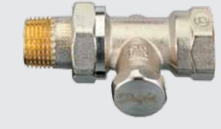
RLV-S Standart Dönüş Vanası