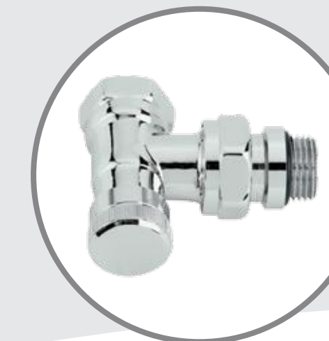
RLV-CX Krom Dönüş Vanası