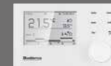
Logamatic RC310 Sistem Kumandası

Logamax plus GB162'yi Buderus uzmanlığı ile üretilen sistem kumandaları, kumanda panelleri ve kontrol modülleri ile kullanın; hem daha çok tasarruf elde edin hem de daha fazla konfor yaşayın.