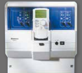
Logamatic R4121 Kumanda Paneli