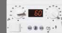
Logamatic BC10 Kazan Kontrol Paneli