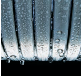
Inox-Radial ısıtma yüzeyi – uzun ömürlü ve yüksek verimli