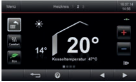
Renkli dokunmatik ekranlı Vitotronic 200 kontrol paneli

Vitodens 200-W, paslanmaz çelik Inox-Radial ısıtma yüzeyi, MatriX-silindirik brülörü ve renkli dokunmatik ekranı sayesinde yüksek verimli, uzun ömürlü ve konforlu bir işletme sunmaktadır.