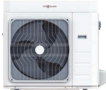
Vitocal 100-A 10 ila 12 kW