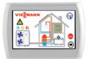
7 adet Vitocal 100-A kaskad işletmek için kontrol paneli