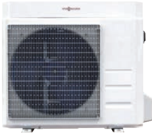
Vitocal 100-A 6 ila 8 kW'sı

Geniş kapasite aralıkları ile soğutma ve ısıtma ihtiyaçları karşılanmaktadır.