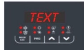
Isı pompasında görüntülenen net göstergeler sayesinde kolay kullanım imkanı