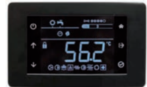
Uzaktan kumanda için konforlu dokunmatik ekranlı kontrol paneli