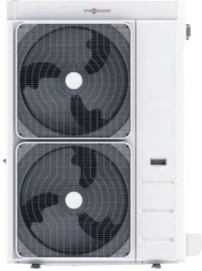
Vitocal 100-A 14 ila 16 kW