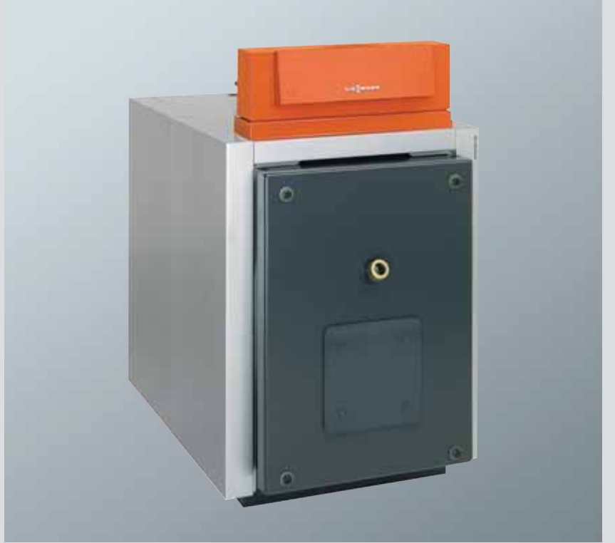
Vitoplex 100 150 - 400 kW